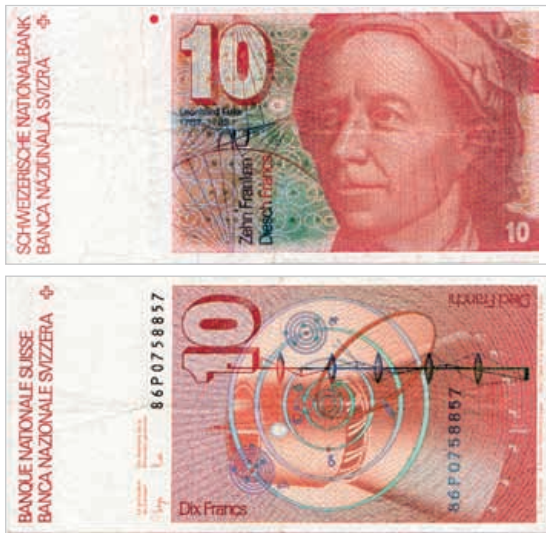
Billete de 10 francos suizos con la efigie de Euler