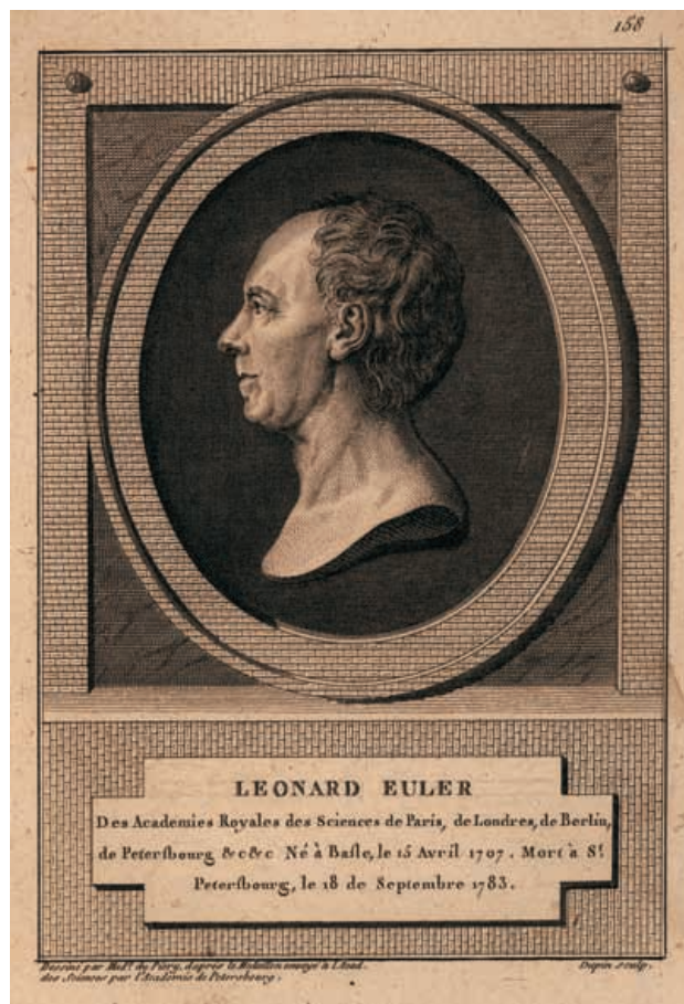
Grabado de Dupin

Leonhard fue un verdadero niño prodigio y no sólo para las matemáticas, pues tenía un don especial para los idiomas y destacaba en todos los estudios que realizaba. Su prodigiosa memoria y su capacidad mental para el cálculo le permitían realizar complicados cálculos aritméticos sin necesidad de utilizar para ello papel y lápiz.